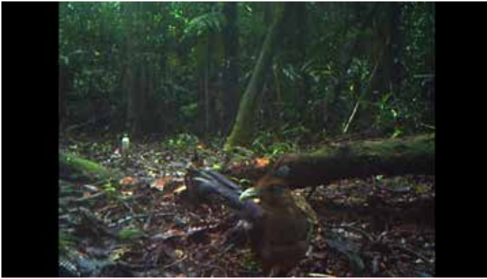
Figura 3. El 28 abril 2013, en Cerro Bolivia.

especie. Un registro fue secuencia de fotos y dos más fueron videos. Estos tres registros en diferentes áreas de la RBB son relevantes porque constituyen eventos pocos conocidos en Nicaragua.