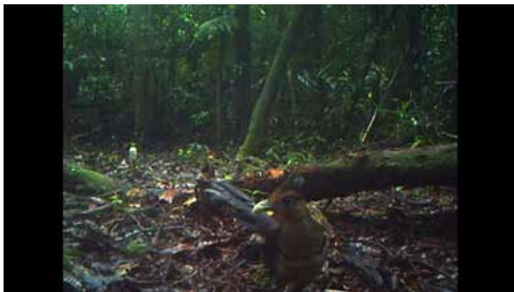
Figura 4. El 19 julio 2013, en la RN Cola Blanca

sumisa y erguida desplazándose hacia la derecha en posición de búsqueda de presas en la hojarasca. Su presencia frente a la cámara nos permitió identificar el color del cuerpo: por encima color café oscuro, el pico es verde amarillento, con una línea postocular oscura, franja pectoral algo irregular color negro, cara y cuello color canela, las plumas de la cresta tonos canela y en su extremo distal tiene tonalidad negra. Las coberteras supra caudales con tonos violeta y cola con tonos más púrpuras como tornasol, el vientre es color crema claro y las patas son gris claro.