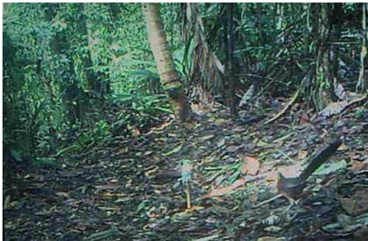
Figura 2. El 16 marzo 2013, en la RN Cola Blanca

el año 2013 y como parte del proyecto JCP/WCS se han establecido trampas cámara en diferentes áreas dentro de la Reserva de Biósfera de Bosawas (RBB) (Díaz Santos et al. en prensa). Las áreas evaluadas son: Mayagna Sauni Bu, Kipla sait Tasbaiska, Cerro Bolivia, Reserva Natural Cola Blanca, Reserva Natural Macizo de Peñas Blancas, Francia Sirpi y Santa Clara, todas las áreas se caracterizan por la presencia de bosque húmedo tropical siempreverde de la región Caribe de Centroamérica, con precipitaciones anuales entre los 2000-3000 mm/año (INETER 2005a) y con una temperatura media anual entre 25° y 26° C (INETER 2005b). Estos bosques naturales presentan poca intervención humana y algunos están dentro de territorios indígenas.